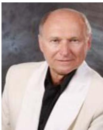
Егоров Вячеслав Павлович

Народный артист России, заслуженный артист Мордовии, лауреат премии губернатора Краснодарского края в области литературы и искусства, ведущий солист Музыкального театра города Краснодара