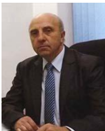
Дедков Владимир Иванович

Заслуженный артист РФ. Лауреат Международных конкурсов. Профессор. Солист Государственного Академического Большого театра.