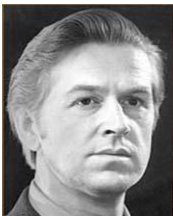
Бабыкин Анатолий Алексеевич

Народный артист России, заслуженный артист Мордовии, лауреат премии губернатора Краснодарского края в области литературы и искусства, ведущий солист Музыкального театра города Краснодара